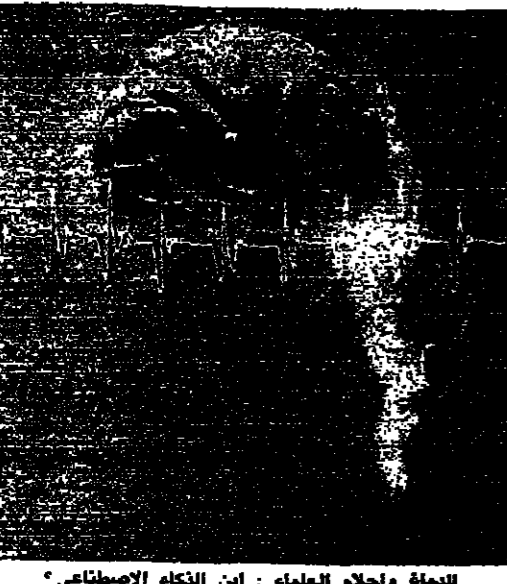
المعلم وحمل العلم: ابن الزكاة الاصطعاني